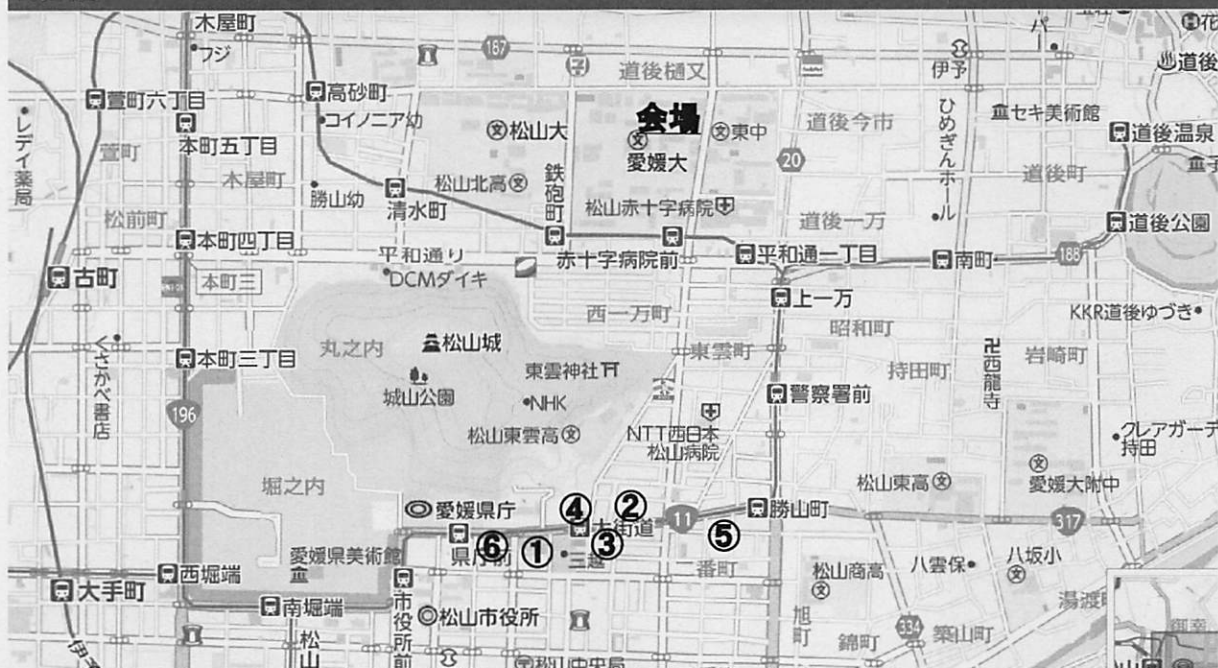
①松山全日空ホテル ②ダイワロイネットホテル松山 ③カンデオホテルズ松山大街道 ④松山東急REIホテル ⑤東横INN松山一番町 ⑥ホテルアビス松山