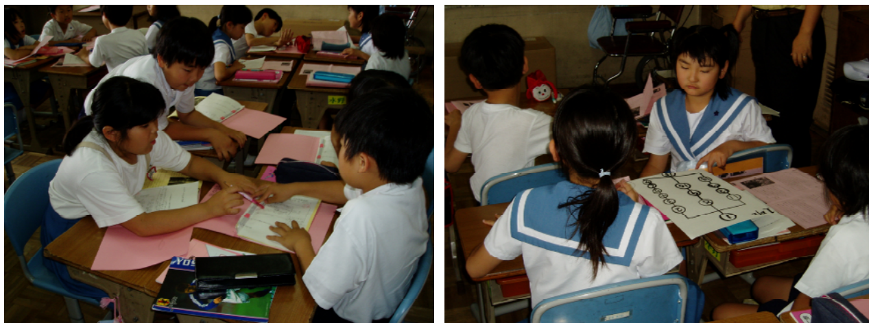
図 2 - 2 学び合い学習

具体的には、単元の学習内容や子どもたちの学習状況に合わせて学習形態を工夫することが考えられる。つまり、目的別のグループや、指導者の評価をもとにしたグループなどを用いて学習を進めていく学習形態にしていくことである。