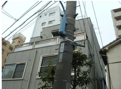
図 4-1 「関弥四郎」宅跡

この関家は、家紋は「揚羽蝶」から「鳳凰丸紋 59 」に変更しており、この「関弥四郎」が関孝和との関連は極めて高そうである。これは、現存する関孝和の墓石とも一致する。しかも、「揚羽蝶」から変更したと記録されている。家紋の面からは、関孝和の養家であることを否定することができないのである。