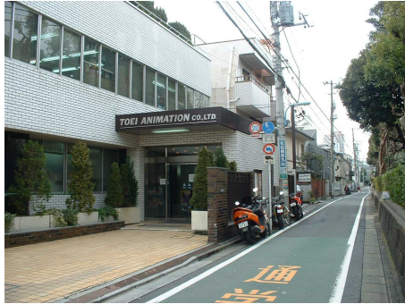
図 4-3 「関文左衛門」宅跡