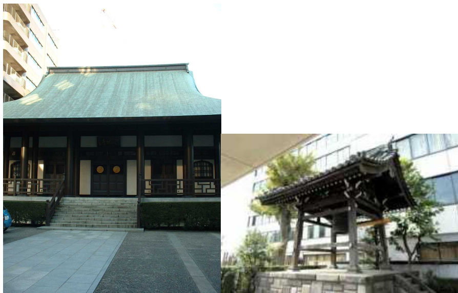
図 2 現在の天龍寺（東京都新宿区新宿四丁目3）

牛込警察署庁舎新築に伴って行われた『新宿区南山伏町遺跡調査報告書』には、関孝和の長兄・内山七兵衛（永貞）宅の発掘調査記録があるが、その一帯の武家屋敷の記述もある。幕末期の名称であるが、それらの屋敷は、