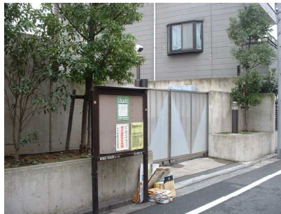
図 4-2 「内山七兵衛」宅跡