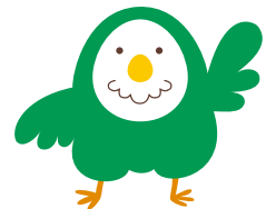
大阪教育大学公式キャラクター 「たまごどり」