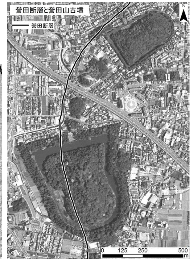
図4 誉田断層と誉田山古墳