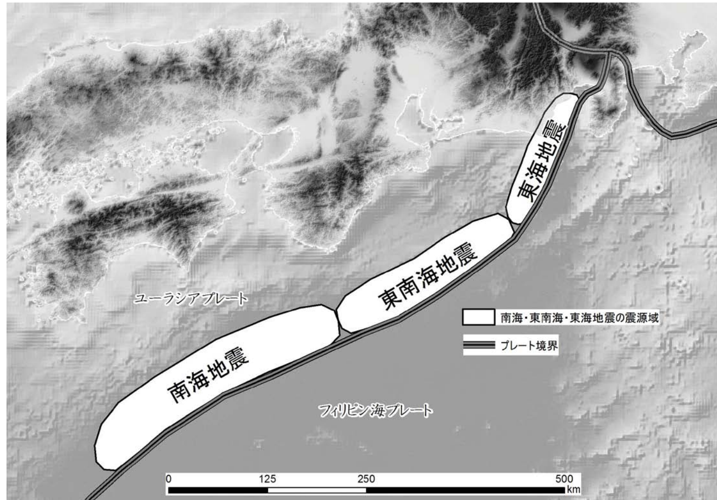
図1 南海地震の震源域