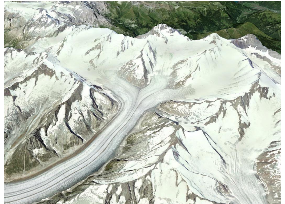
図1 斜め上空から見た氷河