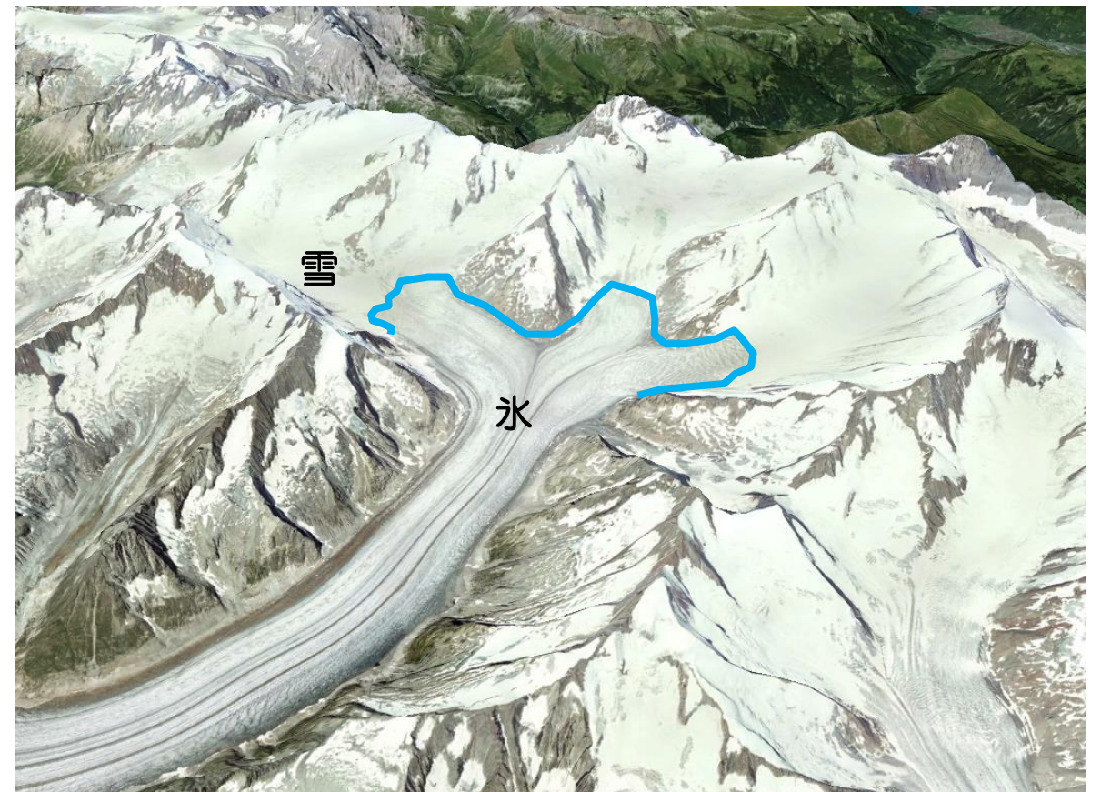
図2 氷河の雪と氷 (範囲は図2と同じ)