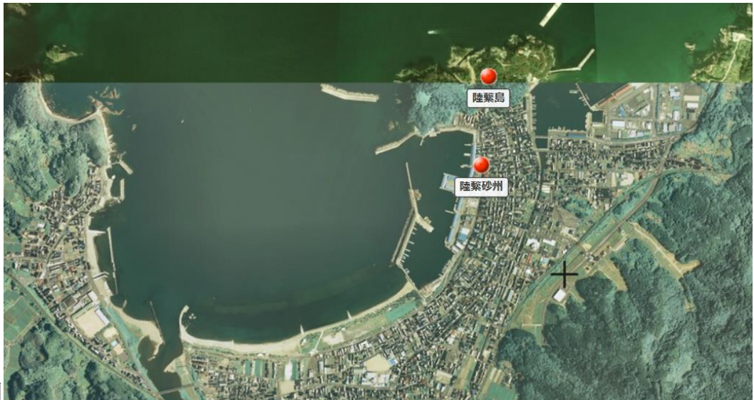
陸繋島と陸繋砂州