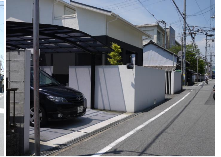
最近建てられた家