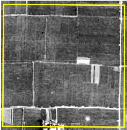
1945 年～1950 年