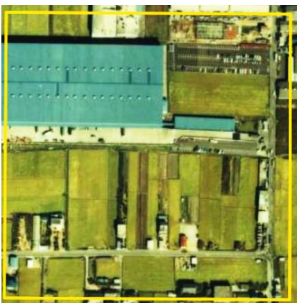
1979 年～1983 年