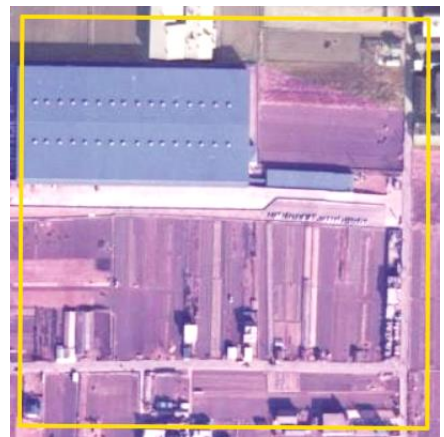
1974 年～1978 年