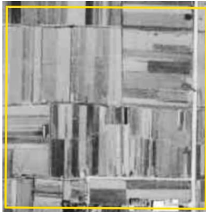
1961 年～1969 年